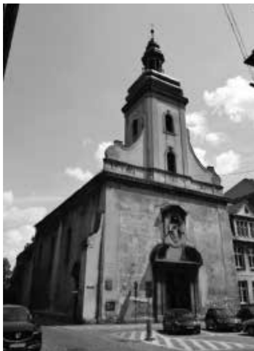
Ilustracja 22 – Kościół minorytów na Placu Klasztornym.