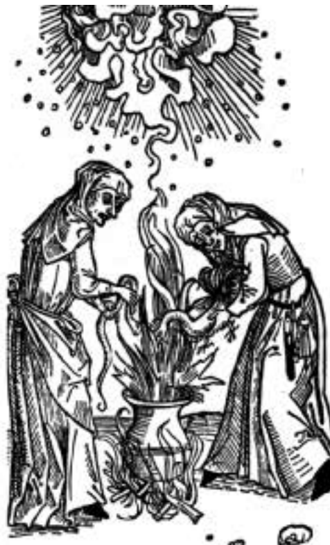
Anonim. Czarownice gotujące tajemniczy wywar, Kupferstichkabinett Städtische Museen Preussischer Kulturbesitz, Berlin

Ilustracja 33 – Przyrządzanie wywaru przez czarownice