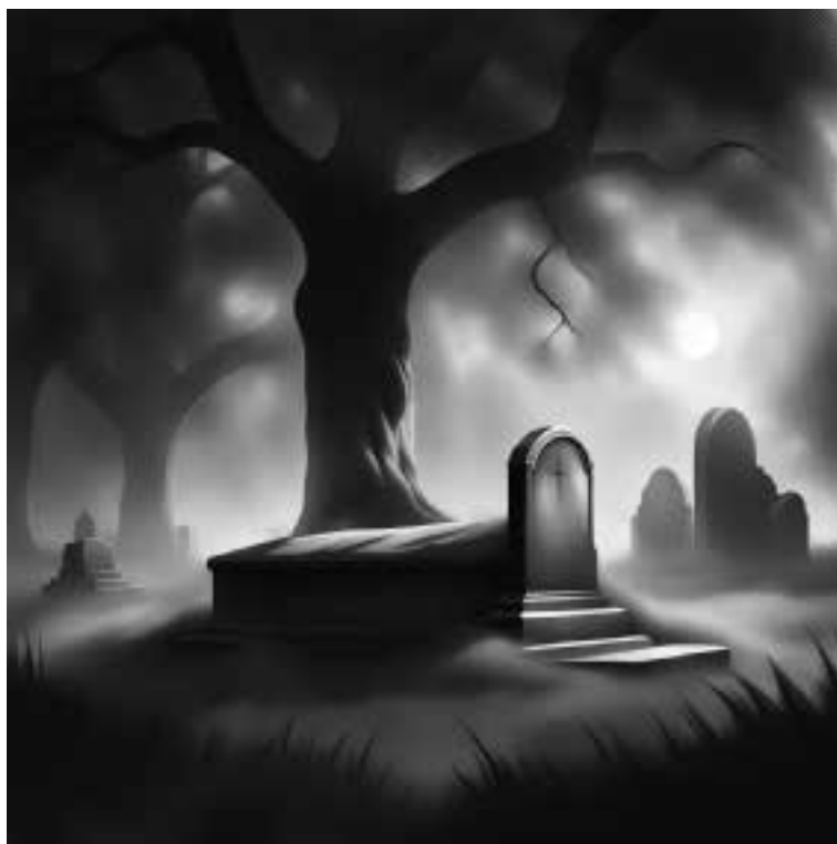
Ilustracja 59 – Mogiła.