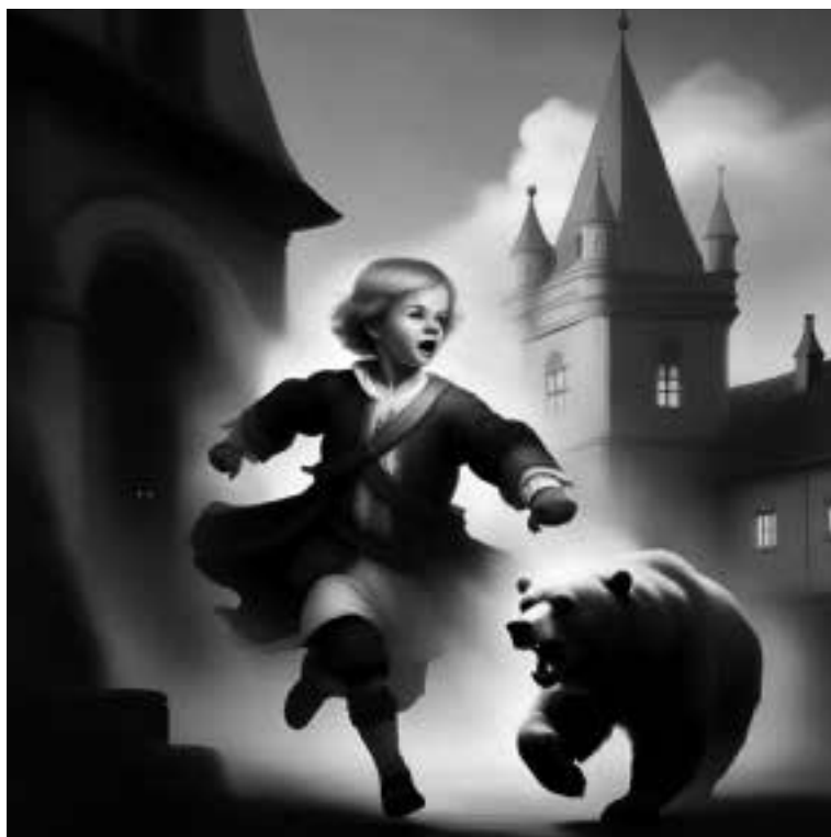
Ilustracja 66 – Chłopczyk i niedźwiedź.

Uczestnicy posiedzenia ze zdziwieniem spojrzeli na siebie. Zaczęli szeptać i komentować słowa Karola. Hrabia z wyraźną pogardą obserwował ich twarze. Trudno było znieść jego przenikliwy wzrok. Miał dopiero 24 lata, a wszyscy członkowie tego posiedzenia byli od niego starsi.