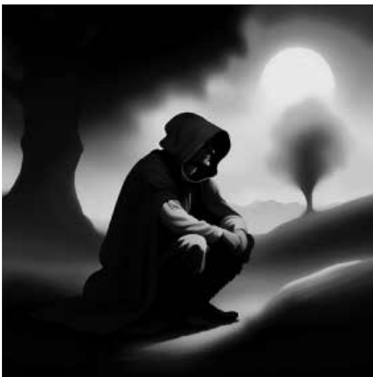
Ilustracja 26 - Mężczyzna siedzący na kamieniu.