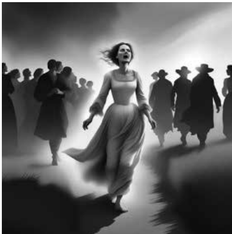
Ilustracja 4 – Pochód Niedzieliny.

boszcz podszedł do leżącej na ziemi kobiety i ręką uczynił znak krzyża na jej czole. Następnie wstał i nieco się od niej odsunął.