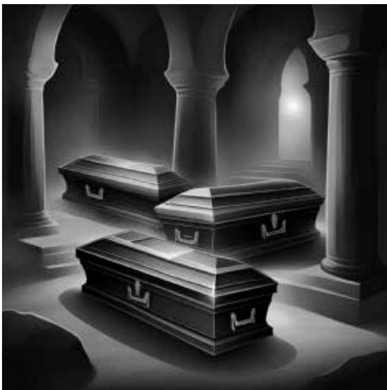
Ilustracja 71 – Trzy trumny.