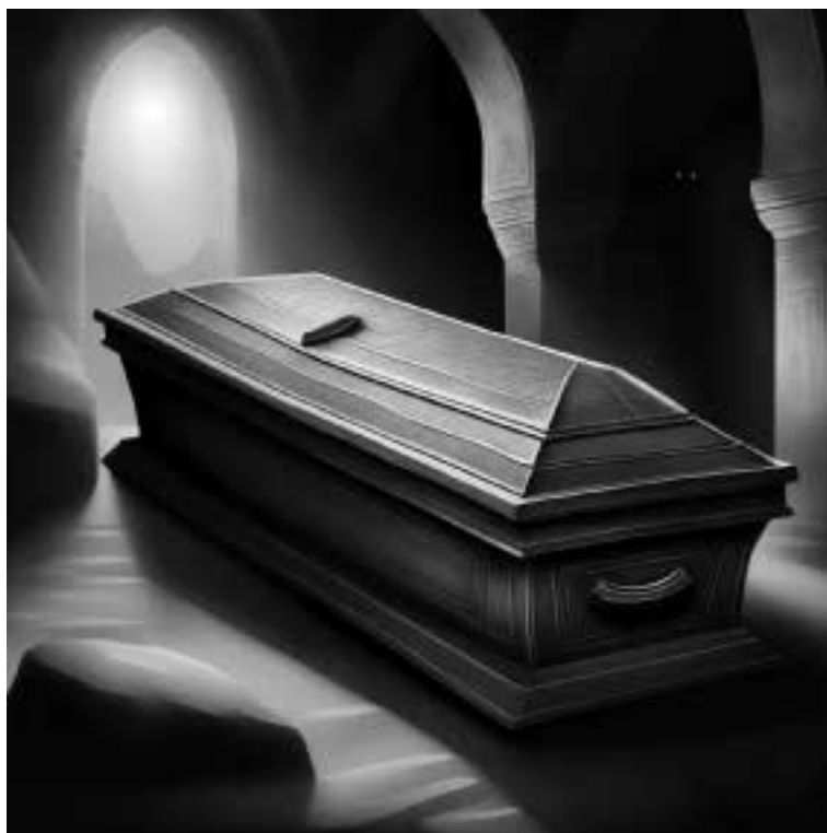
Ilustracja 75 – Trumna hrabiny.