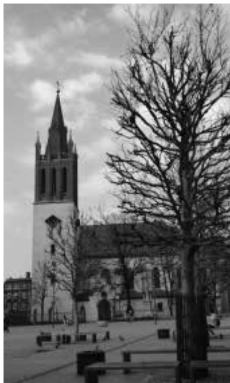
Ilustracja 14 – Kościół WNMP w Bytomiu.