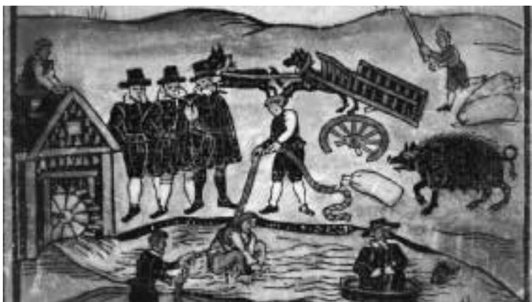
Ilustracja 6 – Próba wody, źródło: internet.

Tego dnia, wypełnionego strachem i ludzką nienawiścią, nikt nie zauważył samotnego wędrowca o błękitnych oczach, który stał w pewnym oddaleniu od stawu w miejscu, skąd doskonale było widać taflę wody i prowadzoną próbę wody. Obserwował zachowanie kobiety. Zauważył, jak strażnik przywiązuje jej skórzany bukłak do uda. Widział, jak kobieta walczyła o życie. Obserwował tłum i jego akty wrogości i nienawiści. Widział wszystko, tylko jego nikt nie zauważył.