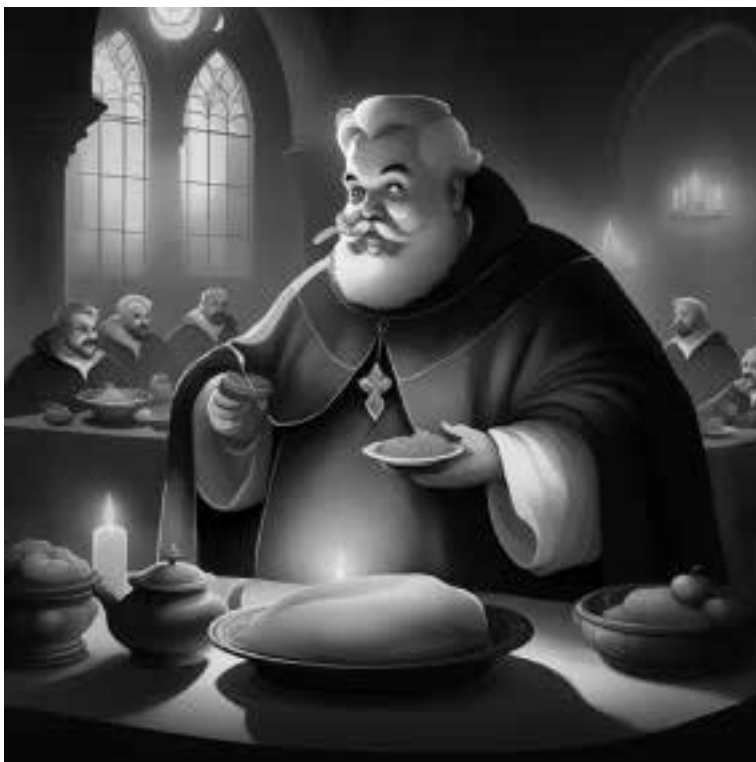
Ilustracja 7 – Kardynał Hipolit Aldobrandini podczas uczyty.

– Zapraszamy do środka – powiedział burmistrz ciągle pozostając w ukłonie – Na stołach czeka stawa i popitek.