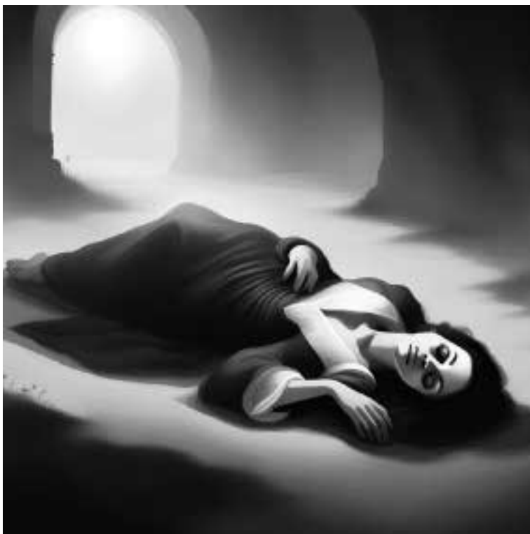
Ilustracja 46 - Martwa kobieta.

- Tak - odparł gwardian - Wiem, że to dziwne, ale tak było. Upadła i umarła na moich oczach. Chorowała?