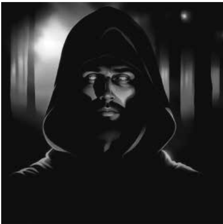
Ilustracja 3 – Mężczyzna o błękitnych oczach.

Każdy z nich do końca życia nie przyznał się nikomu do tego, co tego dnia widział pod ziemią. Odeszli z tego świata i zabrali tajemnicę do grobu.