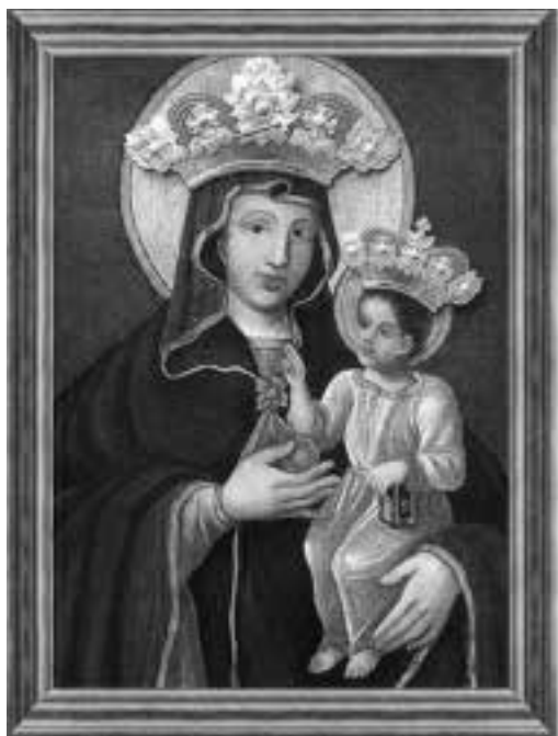
Ilustracja 54 – Matka Boska Piekarska.