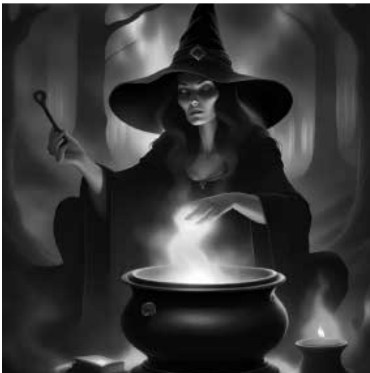
Ilustracja 37 – Czarownica.