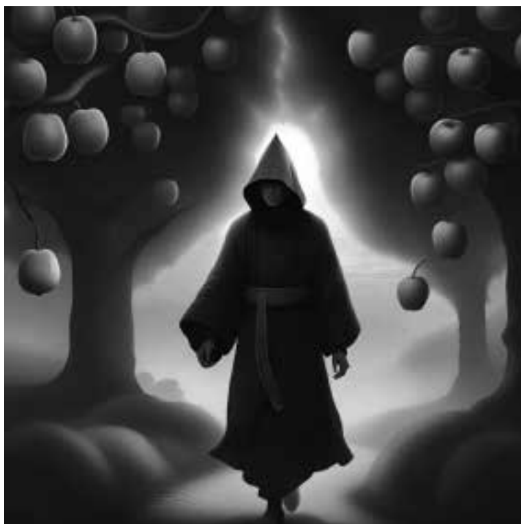
Ilustracja 77 - Mnich w sadzie.

- Wiedziałem, że cię tu znajdę - powiedział.