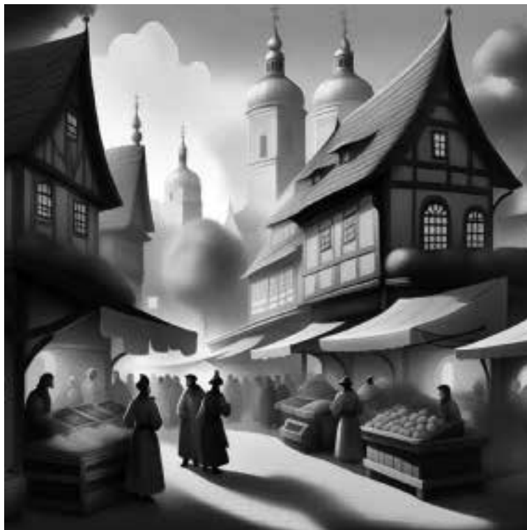
Ilustracja 20 – Targowisko na Rynku.

– Pewnie. Gdzie mi będzie lepiej? Jest co wypić, jest na kogo popatrzeć... – oblizał się obleśnie spoglądając w stronę młodej kobiety, która trzymając pod ręką wiklinowy koszyk przechodziła obok nich. Bracia nie oglądając się za siebie rozeszli się do domów. Janek chwiejnym krokiem ruszył w ślad za młodą kobietą, popijając po drodze z kufła i snując własne, zbereżne fantazje.