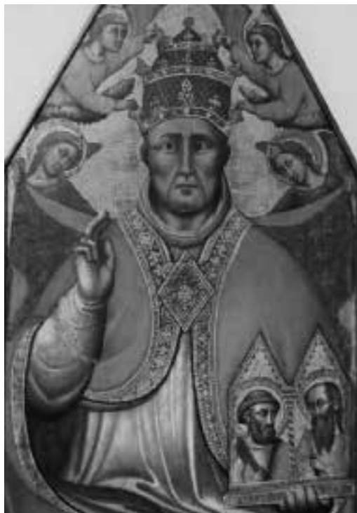
Ilustracja 9 – Papież Urban V; źródło: wikipedia

– Sami sobie na to zapracowali – odparł kardynał – Co dalej z klątwą? Pleban wziął głęboki oddech.