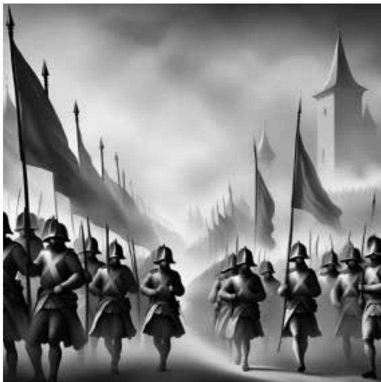
Ilustracja 19 – Przemarsz wojsk.