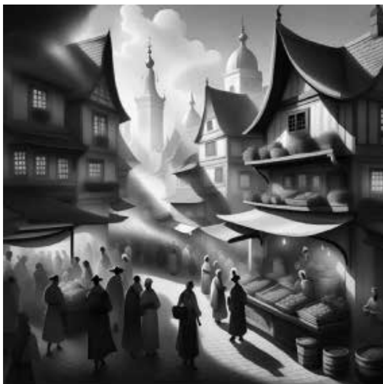
Ilustracja 55 – Targ na Rynku.

Tego lipcowego dnia na bytomskim rynku odbył się kolejny targ. Ludzi było co nie-miara. Piękna pogoda zachęcała do sprzedawania i kupowania. Jak zwykle, na targowisku co chwilę rozbrzmiewały zagniewane głosy, usiłujące nawzajem się obrazić lub sprowokować do działania. Taki handlowy rytuał. Ludzie kręcili się przed straganami podziwiając towary, a czasami je smakując. Dzieci prześlizgiwały się pod nogami, starając się ukraść coś ze stoisk. To wywoływało wrogie okrzyki właścicieli towaru. Czasami nawet ktoś gonił jakiegoś dzieciaka, który w swoim łakomstwie przesadził. Było ciepło, co spowodowało, że wokół unosił się nienajlepszy zapach. Ludzki pot wymieszany z zapachem różnych towarów. Andrzej i Józef wybrali się na targowisko ze swoimi żonami, które chciały dokonać większych zakupów. Kobiety trzymały się razem, a bracia chodzili od straganu do straganu, oglądając towary i wymieniając pomiędzy sobą uwagi. Od czasu do czasu przystanęli, aby móc dłużej porozmawiać.