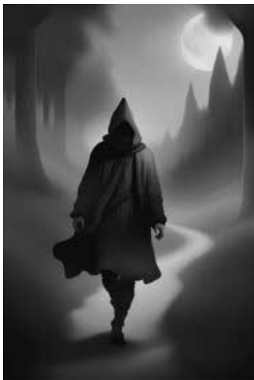
Ilustracja 76 – Mężczyzna o błękitnych oczach.

Bytom się wyludniał. Ludzie porzucali budynki i domostwa, zabierali swój dobytek i ruszali w różnych kierunkach. Często w stronę polskiej granicy. Musiało być to sporym problemem, skoro wrocławski Urząd Zwierzchni podejrzewał, że strona polska w jakiś sposób zwabia do siebie mieszkańców Bytomia. W tym okresie z obszaru państwa bytomskiego wyemigrowało około 300 rodzin. To bardzo dużo. W 1736 r. w całej okolicy panowały ulewne deszcze, zamieniając obszar wokół Bytomia, Piekar i Świerklańca w jedno wielkie bagnisko i mokradła. Deszcz trwał nieprzerwanie przez 73 dni, niszcząc właściwie wszystkie uprawy na polach. Mówiono o zemście czarownic. Zapanował głód. Na jego efekty nie trzeba było długo czekać. W 1737 r. w okolicy wybuchła epidemia gorączki, z powodu której w samym mieście Bytom zmarło około 300 osób. Zły krążył wokół hrabiego, uśmiechając się do niego szyderczo i ciągnąc za sobą całun śmierci. W 1737 r. bytomski rynek opustoszał. Ludzie, bojąc się kontaktów z drugim człowiekiem, pozamykali się w domach. Rodzice zabraniali bawić się dzieciom na podwórkach. Zamknięto szczelnie okna. Jedynie niektórzy w bytomskich kościołach żarliwie wznosili swoje ręce ku Bogu, prosząc o uratowanie ich od zarazy. Ludzie umierali w domach, na ulicach, poza murami miasta. Wszędzie. Pojawił się też tyfus. Samo słowo wywoływało przerażenie. Niektórzy pod wpływem wysokiej gorączki tracili wszelki rozsądek i popadali