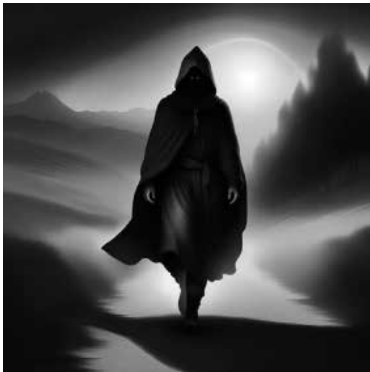
Ilustracja 41 – Mężczyzna o niebieskich oczach.

- Chodźcie za mną - powiedział niebieskooki i ruszył drogą. Kobiety, jakby z nowymi siłami, posłusznie podążyły za nim.