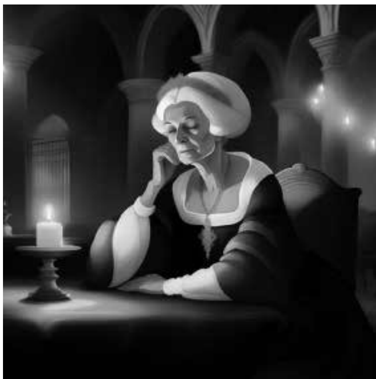
Ilustracja 69 - Zasmucona hrabina.