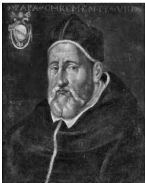
Ilustracja 10 – Papież Klemens VIII