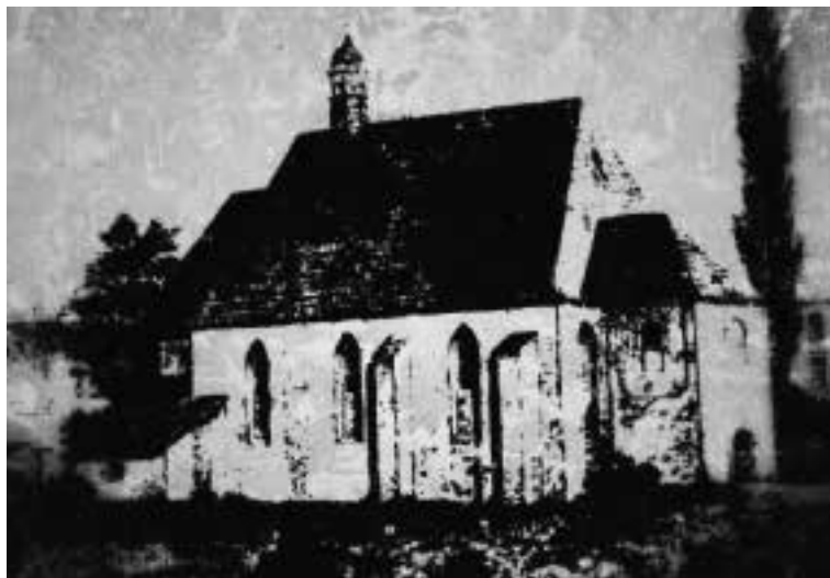
Ilustracja 39 – Kaplica cmentarna z 1617 r. na cmentarzu miejskim