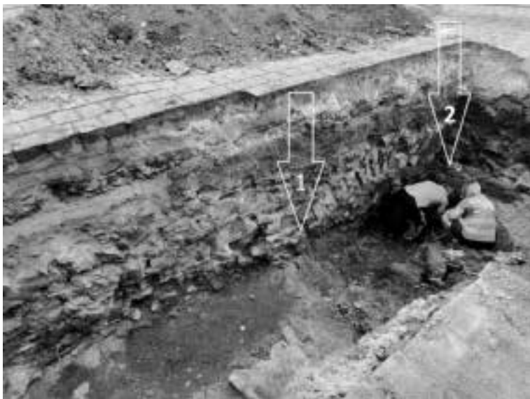
Ilustracja 85 – Zdjęcie z prac archeologicznych w Bytomiu na Placu Klasztornym w 2024 r. Strzałka nr 1 wskazuje miejsce znalezienia szkieletu młodej kobiety (prawdopodobnie XVII w.) a strzałka nr 2 resztek trumny i szczątków mężczyzny (prawdopodobnie koniec XVIII w. lub XIX w.).

Donnersmarckowie powrócili na Śląsk. Podali sobie dłoń z pruskimi Hohenzollernami, tworząc potężne imperium przemysłowe. Stali się górnośląskimi potentatami w dziedzinie wydobywania surowców i ich przeróbki. Dorobili się ogromnego majątku, który należał do jednego z największych nie tylko w Królestwie Pruskim, ale również w zjednoczonym Cesarstwie Niemieckim i całej Europie. Stali się twórcami górnośląskiego przemysłu ciężkiego, jak również fundatorami wielu osiedli przemysłowych, katolickich i ewangelickich świątyń, jak również mecenasami miejscowej kultury. Wszystko uległo zupełnej zmianie. Guido Henckel von Donnersmarck (1830-1916), pruski książę i 13 wolny pan stanowy Bytomia zakochał się w pewnej kobiecie o przedziwnej i dość kontrowersyjnej reputacji. Markiza Blanka de Païva 250 ze względu na swój tryb życia oraz sposoby przyciągania uwagi wielu mężczyzn w dawnych czasach zostałaby pewnie okrzyknięta wiedźmą. Druga małżonka tego samego człowieka, Rosjanka Katharina Slepzow opisywana jako jedna z najbardziej wpływowych i majątnych dam w Niemczech swojej epoki, mieszkając w Kozłowej Górze była znana ze swojego dziwnego zachowania podczas codziennych spacerów, gdy przytulała się do drzew i rozmawiała z nimi. W XVII w. zapewne byłby to dowód na czarostwo. Kiedyś panowało takie szaleństwo.