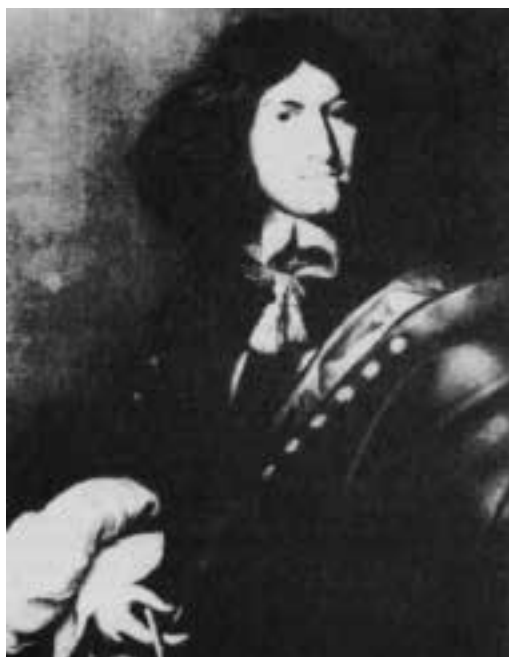
Ilustracja 18 – Hrabia Łazarz II