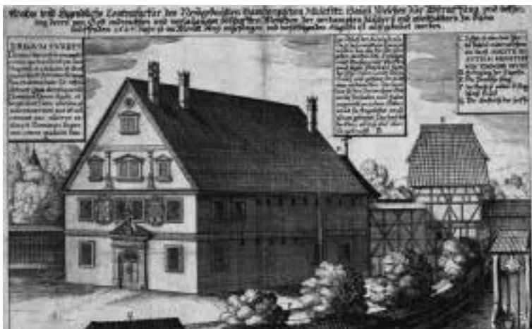
Ilustracja 83 – Specjalne więzienie dla kobiet w Bambergu

je na istoty słabsze, bardziej skłonne do czarów i magii. Pojawiły się osoby, które pod płaszczykiem Świętej Inkwizycji zaczęły dokonywać swoich straszliwych czynów, jak biskup Beauvais Pierre Cauchon (1371-1442), który oskarżał Joannę d'Arc i przyczynił się do jej śmierci. Nie tylko katolicy potępiali rzekome czarownice. Robili to również protestanci, a sam Marcin Luter wypowiadał się o nich bardzo negatywnie i wrogo. Całym sercem wierzył w ich istnienie. Pod koniec XVI w. i w całym XVII w. polowania na czarownice w niektórych krajach Europy przybrały szczególnie na sile.