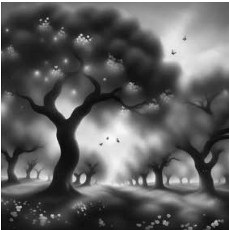
Ilustracja 82 – Kwitnący sad.

w zakonnym, minoryckim habicie. Brat złapał go za ramię i odwrócił. Ciało mężczyzny bezwiednie się poddało.