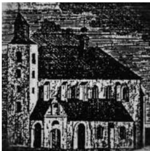
Ilustracja 51 – Kościół WNMP w XVII w.