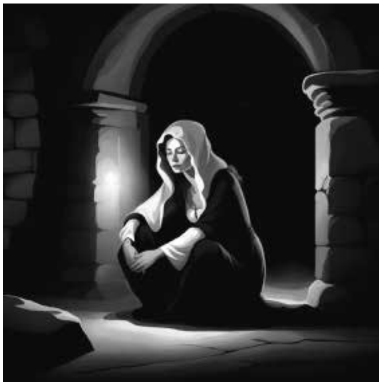
Ilustracja 52 - Kossurowa w celi.