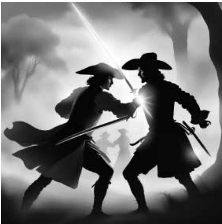
Ilustracja 68 – Pojedynek.

Obydwaj hrabiowie ponownie skinęli głowami. Leon Ferdynand z wyższością patrzył na swojego przeciwnika. Gustaw był od niego nieco starszy. Hrabia Donnersmarck walczył już na polu bitwy. Widział dużo krwi i śmierci. Zresztą, sam ją zadawał. Był pewien, że bez trudu pokona swojego mniej doświadczonego przeciwnika.