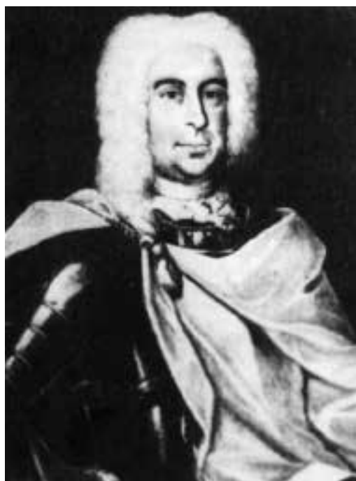
Ilustracja 62 - Hrabia Karol Józef