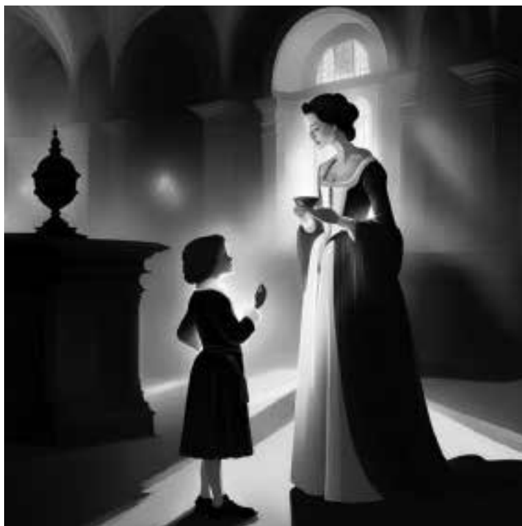
Ilustracja 61 – Rozmowa hrabiny z synem.

Karol spojrzał na nią wystraszonym wzrokiem.