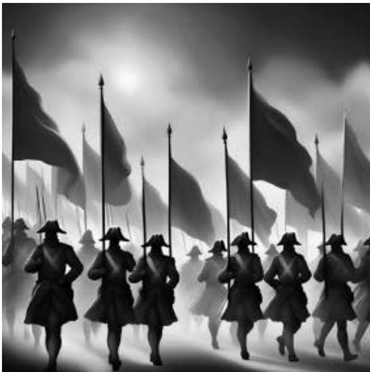
Ilustracja 28 – Przemarsz wojsk.