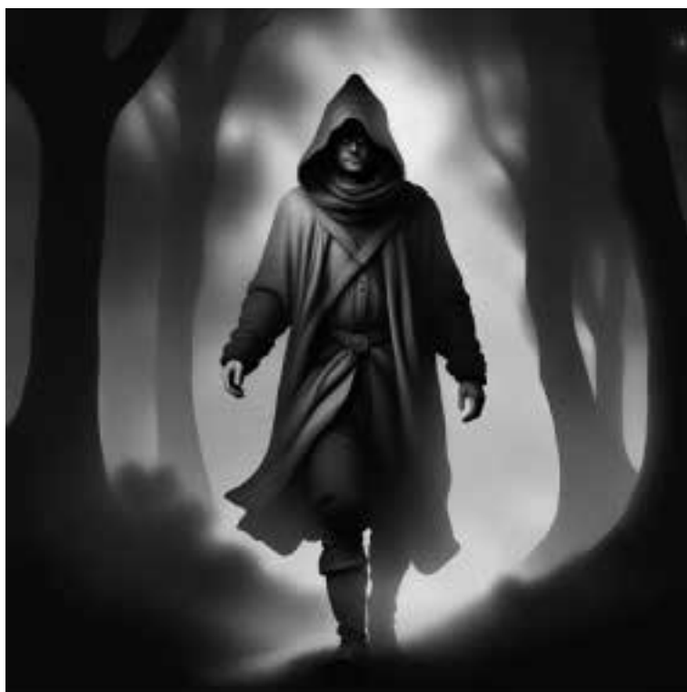
Ilustracja 67 – Mężczyzna o niebieskich oczach.