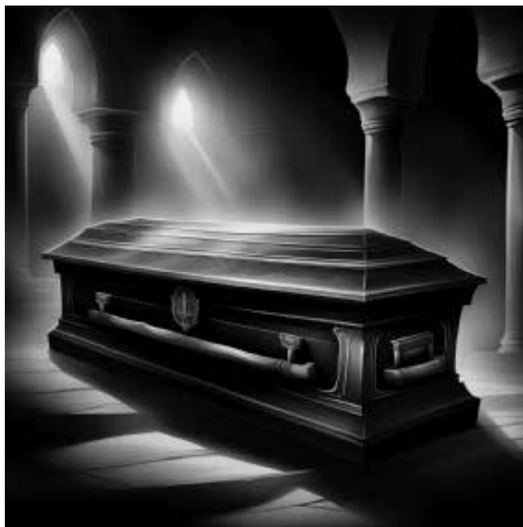
Ilustracja 53 – Trumna hrabiego.

Powolnym krokiem ruszył w stronę swojego domostwa, a wiosenny ciepły wiaterek smagał go po twarzy. Andrzej uśmiechał się do niego, a może do swoich myśli. Nie wiedział, że jego brat cały czas uważnie go obserwuje.