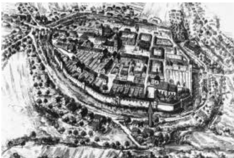
Ilustracja 21 – Dawny klasztor minorytów na Placu Klasztornym w Bytomiu.