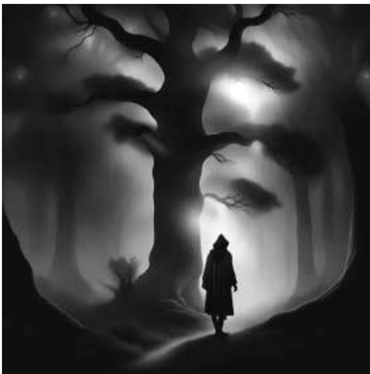
Ilustracja 73 – Samotny mężczyzna.

Mężczyzna nie odpowiedział. Nie wykonał też żadnego ruchu.