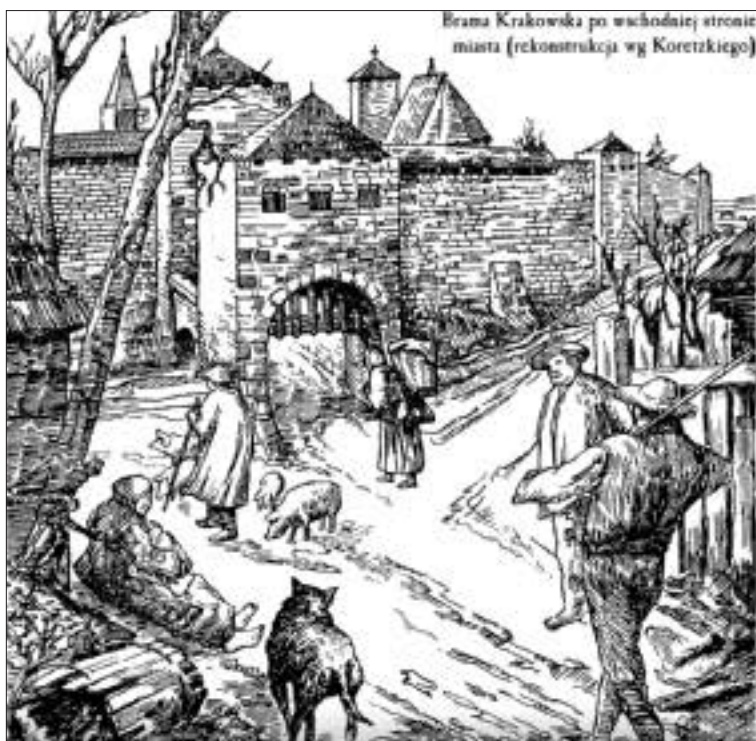
Ilustracja 12 – Brama Krakowska według ryciny Koretzkiego.

takiego końca. Bała się jednak o swoją rodzinę i dzieci. Co z nimi będzie? Jak będą traktowane jako dzieci rzekomej wiedźmy? Czy one też nie spłoną na stosie? Tysiące pytań, na które nikt nie potrafił teraz odpowiedzieć. Głośnie obelgi nie ustawały. Ludziom bardzo łatwo przychodziło wykrzyczeć swoją nienawiść wobec niesłusznie skazanej kobiety. Nie zdawali sobie sprawy z tego, co jest prawdą. Gdy doszli nad staw, pleban Kossubius podniósł wysoko rękę. Tym gestem wszystkich uciszył.