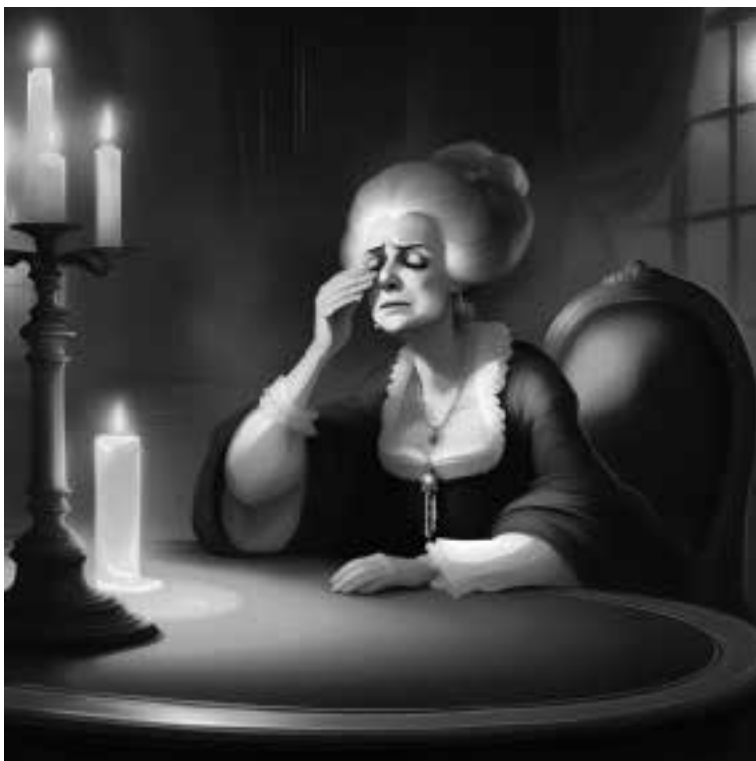
Ilustracja 74 – Płacząca hrabina.

- Chciałem ci tylko powiedzieć... - powiedział zmieszany.