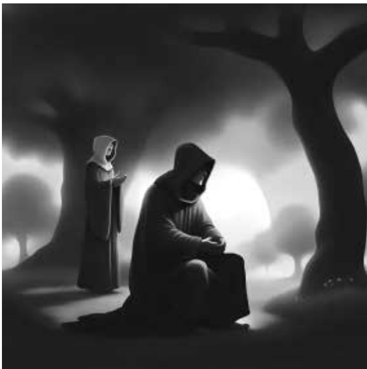
Ilustracja 45 – Rozmowa mnicha z kobietą.

łam Krystynie o swoim problemie, a ona poradziła mi, żebym skontaktowała się z tobą.