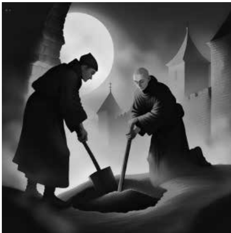
Ilustracja 47 - Pochówek.

- Pochowamy ją pod murem 146 - odparł zakonnik - Tam nikt jej nie znajdzie.