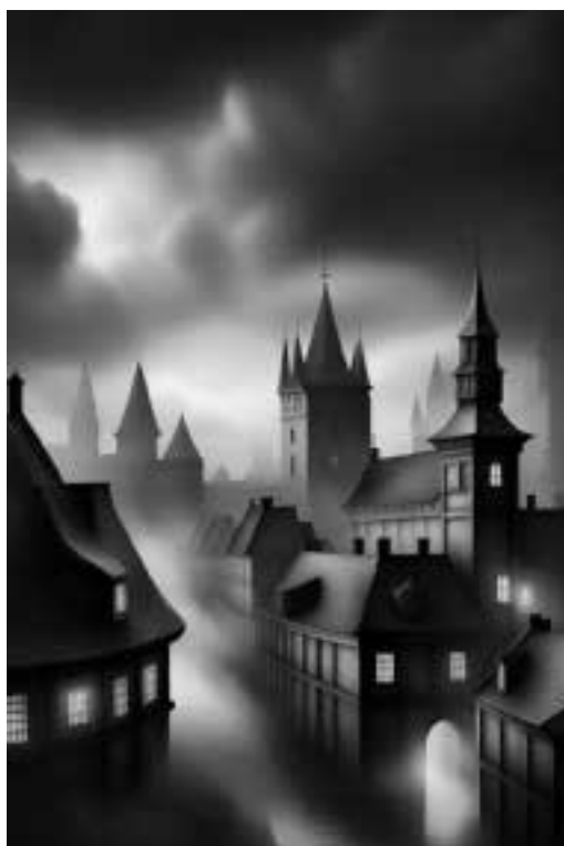
Ilustracja 49 – Miasto nocą.