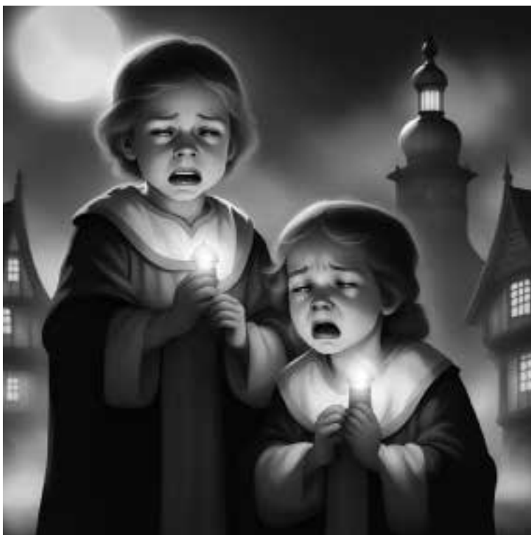
Ilustracja 48 - Placzące dzieci.

- Nikt nie może się dowiedzieć. Zdarzały się przypadki, że dzieci czarownic także oskarżano i palono na stosie. Ciebie też mogą... - mówił z wielkim przekonaniem w głosie zakonnik.