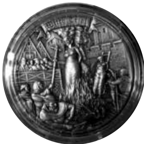
Ilustracja 84 – Medal upamiętniający procesy czarownic (2022); źródło: wikipedia.

żeńską populacją danego miasta (np. Rottenburg). Zdarzały się również bezczelne nadużycia 242 .