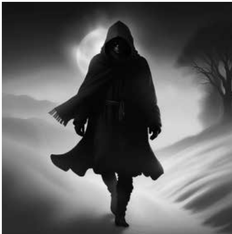
Ilustracja 70 – Mężczyzna o błękitnych oczach.

i próbował go podnieść. Wtedy zauważył, że jego kompan z przerażeniem wpatruje się w coś za plecami Łazarza. Spojrzał w tym kierunku. Obok nich stał mężczyzna w skromnym stroju wędrowca, w dużym kapturze zarzuconym na głowę. Nie odzywał się. Po prostu stał. Łazarz chciał się do niego odezwać, poprosić o pomoc lub o litość, ale zaniemówił. Spowodował to kolor oczu mężczyzny. Jasnobłękitny.