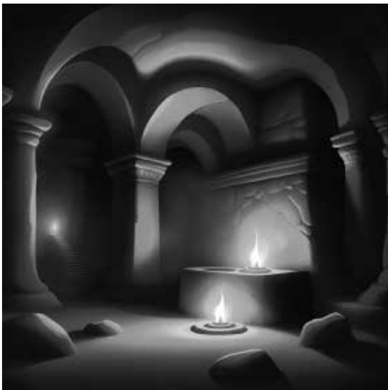
Ilustracja 81 – Podziemna komnata.