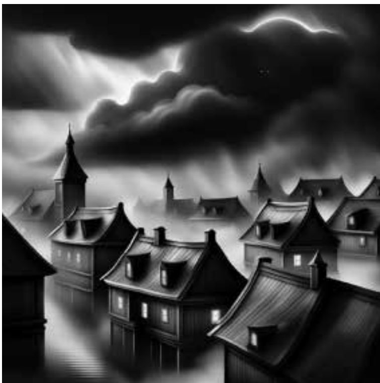
Ilustracja 31 – Zimowe miasto.

Józef wiedział, że Andrzej po śmierci hrabiego Gabriela bardziej uwierzył w jego słowa i teorie. Rozmawiali o tym potajemnie podczas świąt Bożego Narodzenia.