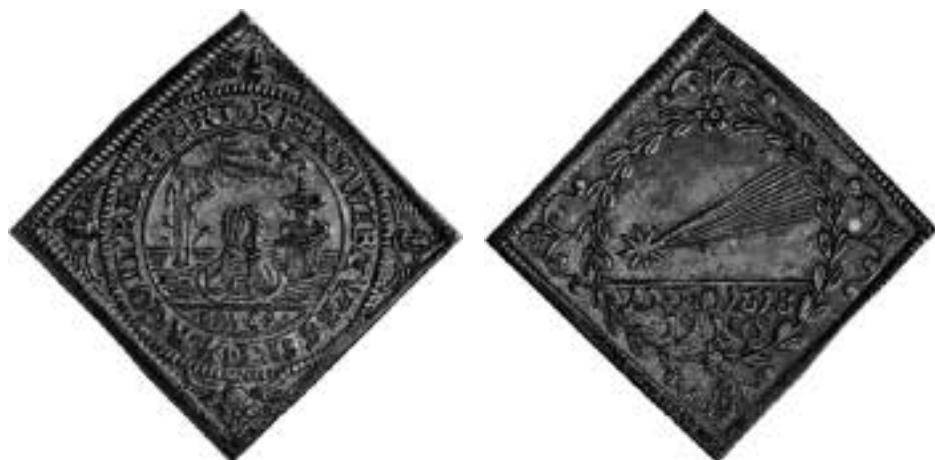
Ilustracja 30 – Awers i rewers medalu wybitego z okazji przelotu komety w 1618 r.