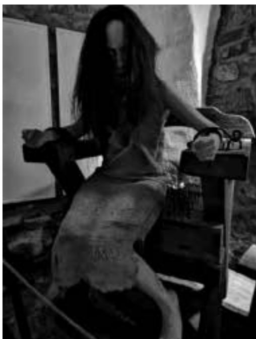
Ilustracja 24 - Kurowa podczas przesłuchania.