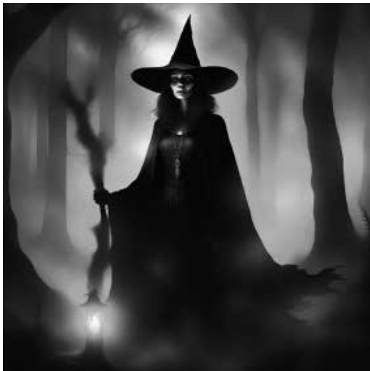
Ilustracja 60 – Czarownica.

kę Sarah Good oraz schorowaną Sarah Osborne. Obydwie stanowczo zaprzeczyły oskarżeniom, ale niewolnica obciążała je kolejnymi zeznaniami. Prawdopodobnie robiła to po to, aby samej się uratować. Tak zaczął się przerażających proceder obciążania kolejnych mieszkańców – nie tylko kobiet, ale również mężczyzn.