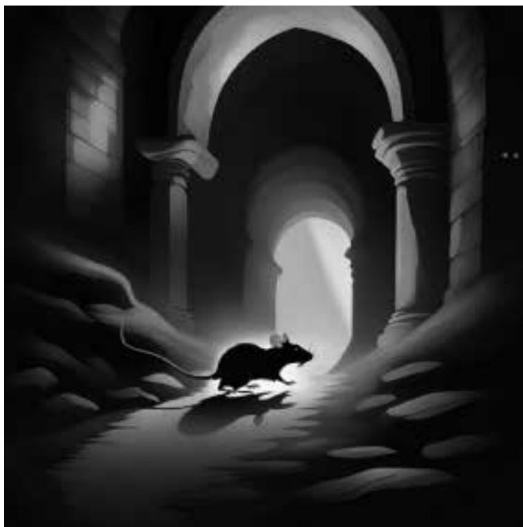
Ilustracja 36 – Więzienny korytarz.

– Słyszałem, że w Raciborzu dzieje się podobnie – powiedział trzeci z ławników, który dotąd nie odzywał się – W 1663 r. odbył się tam pierwszy proces o czary. Skazano trzy kobiety. Podobno szykują się następne.