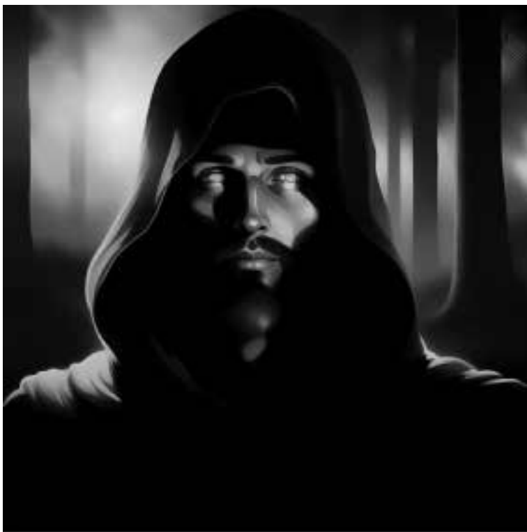
Ilustracja 35 – Mężczyzna o błękitnych oczach.