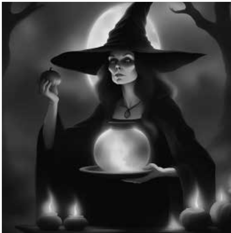
Ilustracja 1 – Czarownica.

decydowałem, że postacie będą ze sobą rozmawiały używając współczesnego języka. Gdybym siłił się na użycie języka z XVII w., pewnie nic by z tego nie wyszło, a poza tym byłoby to mało zrozumiałe. Większość postaci to ludzie, którzy faktycznie żyli w tamtych czasach i byli związani z Bytomiem. Faktem również jest, że w XVII w. 80% mieszkańców miasta używało j. polskiego, a ich nazwiska i imiona również wskazują na polskie pochodzenie. Postacie związane ze światem hrabiowskim noszą niemieckie nazwiska i imiona. Ta różnica była doskonale widoczna.