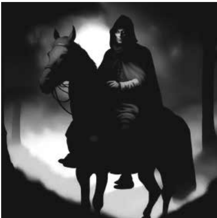
Ilustracja 57 - Mężczyzna o niebieskich oczach.

- To był Niebieskooki, o którym mówiliście. Jestem tego pewna - zakończyła swo- ją opowieść kobieta.