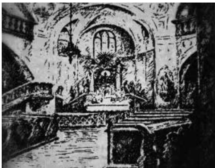
Ilustracja 8 – Wnętrze kościoła św. Ducha w Bytomiu

– Meravigliosamente. Eccellente 21 . Wygląda jak kaplica cmentarna. No nic, idziemy – powiedział Aldobrandini i ruszył w stronę kościółka, przy którym stała grupa ludzi wyraźnie czekająca na kardynała. Wśród nich był proboszcz tego kościoła. Po krótkim przywitaniu kardynał wszedł do niewielkiego kościółka, po brzegi wypełnionego wiernymi. Odprawił mszę świętą. Tego dnia o nic więcej nie pytał. Tylko po zakończonym nabożeństwie szepnął w stronę proboszcza – Oczekuję księdza u siebie, i to pilnie. Pleban ze zrozumieniem skinął głową.