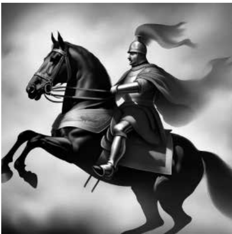
Ilustracja 58 – Król Jan III Sobieski.