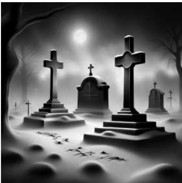
Ilustracja 78 - Dwie mogiły.

- Teraz rozumiem, skąd tak dobra znajomość tych miejsc - powiedział franciszkanin.