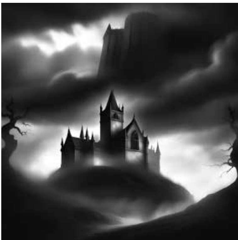
Ilustracja 44 - Zamek Morawski.

- Nie chciałem tam zostawać. Tam ściany śmierdzą grzechem, pychą i ludzkim występkiem. Wolałem ryzykować podróż w nocy.