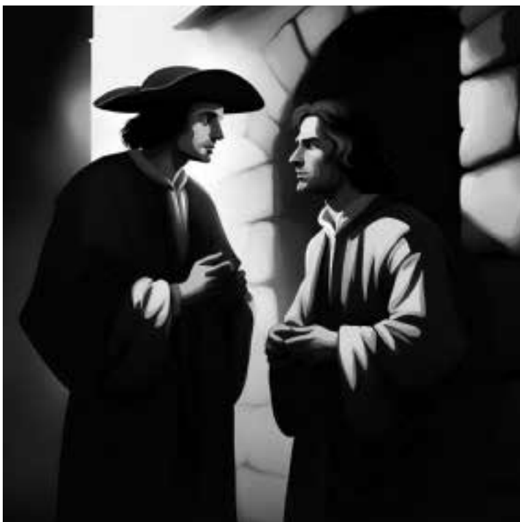
Ilustracja 17 – Rozmawiający bracia.

– Margrabia Jerzy ruszył na wojnę – snuł swoją opowieść Józef – Został wybrany dowódcą wojsk protestantów śląskich, walczących z katolickim cesarzem Ferdynandem II Habsburgiem. Stany śląskie wystawiły armię liczącą cztery tysiące piechoty i dwa tysiące jazdy. Podzielono ją na dwie części. Jedna została na Śląsku, by go bronić przed ewentualnym uderzeniem od strony Polski, a druga część ruszyła pod Kłodzko.