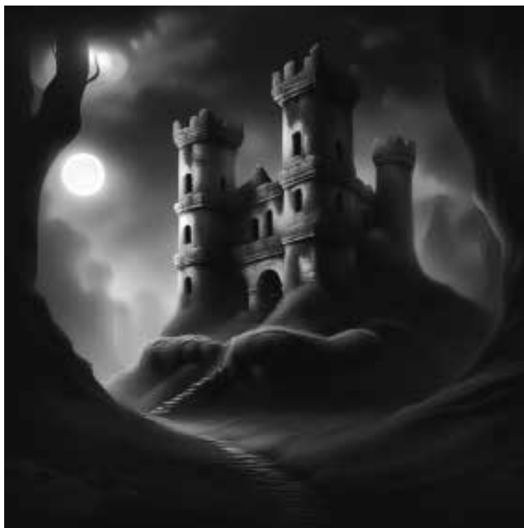
Ilustracja 56 – Zamek na Winnej Górze.