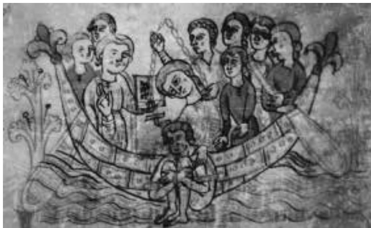
Ilustracja 5 – Próba wody, źródło: internet.

na ziemię. Jeden z nich pochylił się z nożem w rękę. Szybkim i wprawnym ruchem rozciął jej więzy i wyciągnął krępujący kij. Wyrzucił go w krzaki, ale jego towarzysze śledzili lot, by lepiej zapamiętać miejsce. Później mieli po niego wrócić. Katarzyna Niedzielina nadal wypływała z siebie wodę, krztusząc się niemiłosiernie.