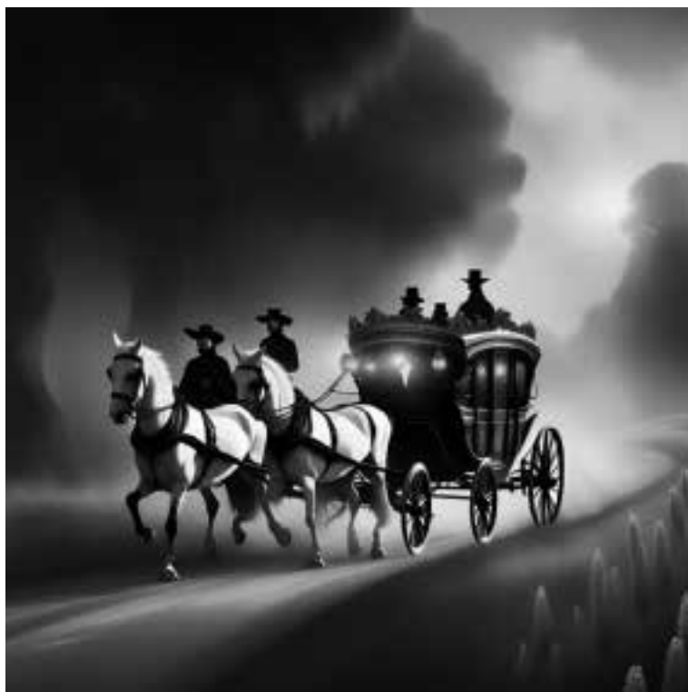
Ilustracja 72 – Hrabiowski powóz.

– Szybciej! – krzyknął hrabia wchodząc do powozu – Nie ma czasu!