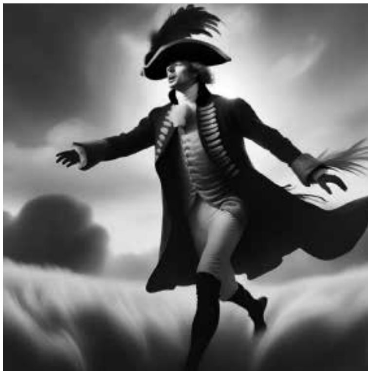
Ilustracja 80 – Uciekający hrabia.

Powóz przejechał koło cmentarza. Powoziło nim dwóch woźniców, a koło powozu jechało dziesięciu konnych, którzy stanowili osobistą straż. Na tyle było jeszcze hrabiego stać. Minęli karczmę prowadzoną przez Żyda Böhma, która czasy swojej świetności miała już dawno za sobą. Gdy przejeżdżali koło Ścinadła, hrabia zauważył coś dziwnego.